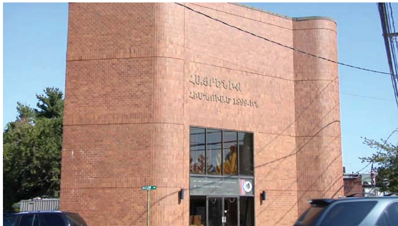
Հայրենիքի շէնքը ուր կը գտնուի ՀՅԴ Արխիւներու Հիմնարկը

Առաջին չորս հատորները խմբագրած է Հրաչ Տասնապետեան, իսկ յաջորդող 5 հատորներու խմբագիրն է Երուանդ Փամպուքեան: Այս հրատարակութիւնները ժամանակագրական շարքով կը հասնին մինչեւ 1911: